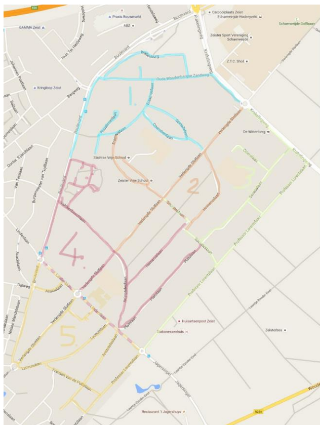
De plattegrond toont de indeling in groepen.

Op grond hiervan kunnen we dus concluderen dat buurtpreventie geen overbodige luxe is!